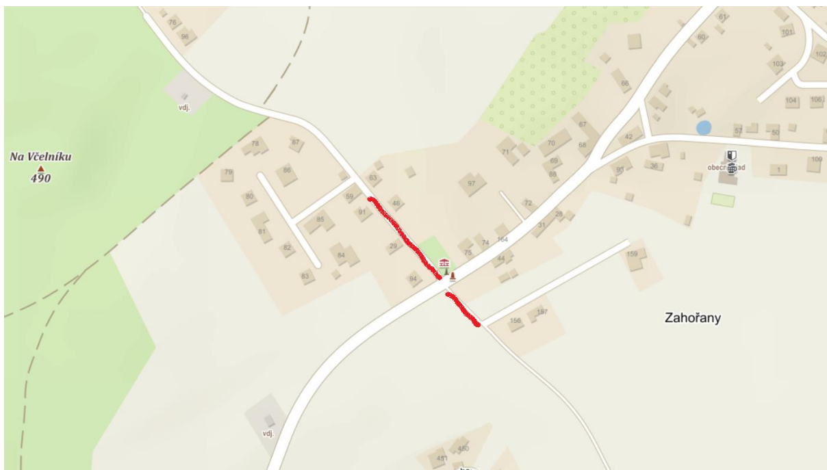
Lokalita: "u pomníku" na začátku vesnice ve směru z Nové Vsi pod Pleší

Parkujte vpravo ve směru jízdy. Neparkujte, prosím, nikomu před vjezdem. Dbejte, prosím, pokynů pořadatelů na místě. Vjezd do Starých Zahořan bude po dobu závodu uzavřen.