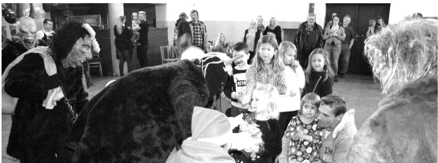
Mikulášská besídka 2018