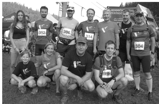
Tým SK Zahořany

Krkonošská 50/21 konaná dne 4.8.2018 ve Špindlerově Mlýně. Nejlepší