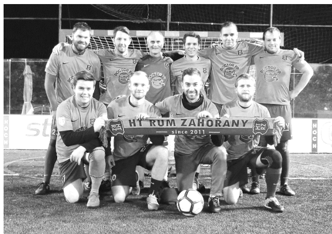
HT Rum Zahořany – Podzim 2018

Úvodní utkání sezóny se nám nevyvedlo, ale jako by zapůsobilo známé pravidlo "první vyhrání z kapsy vyhání". V dalších kolech se výkony Zahořan začaly zlepšovat a postupně jsme se prokousávali tabulkou až na postupové příčky. V klíčovém zápase, těsně před koncem sezóny jsme zvítězili nad týmem Rošambo v poměru 3:1. Osmé vítězství v sezoně nám tak i přes závěrečnou prohru zajistilo návrat zpět do 5.té ligy.